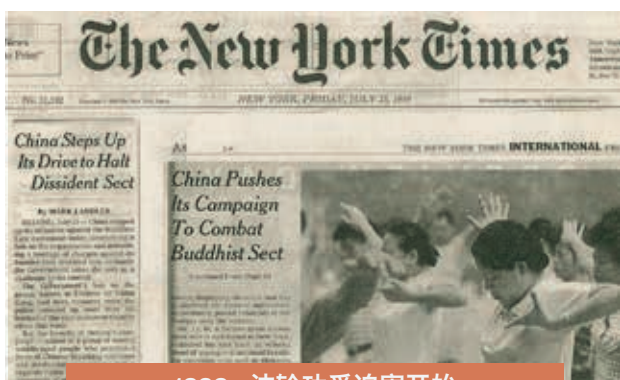
1999 • 法轮功受迫害开始