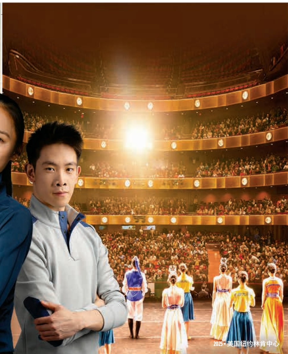
2025 • 美国纽约林肯中心