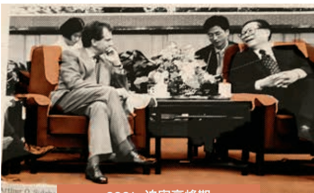
2001 • 迫害高峰期

《纽约时报》在报导中共对法轮功的残酷镇压时，往往偏向采用中共政府的消息来源。该报不加批判地重复，甚至似乎已内化中共宣传的核心说辞——即使这些说法与《纽约时报》早期自己的报导内容以及人权组织逐渐揭露的研究结果相互矛盾，这种情况仍持续存在。