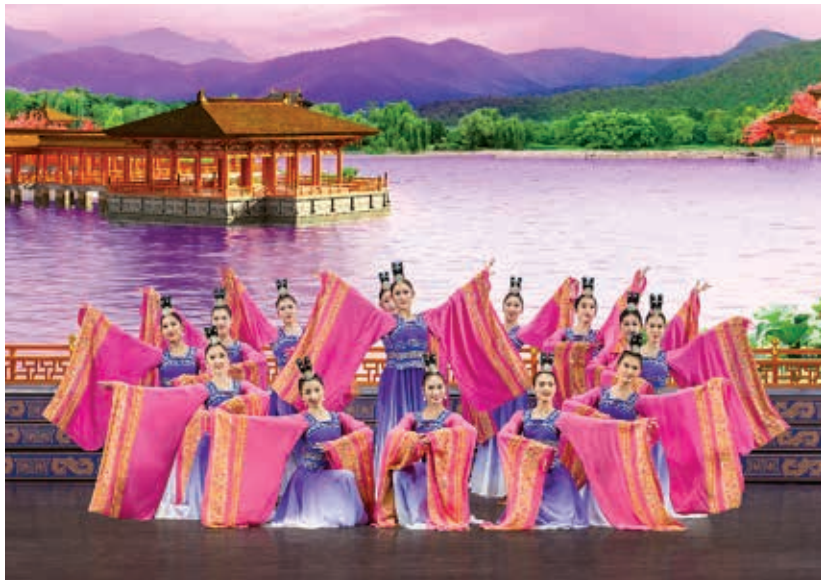
神韵的创立完全是由志愿者自发推动，没有任何政府或企业的资助。

“这是中华文明真正的宝藏……实在太棒了，达到世界级水准……这让我想起了自己当初为什么选择研究中国。”