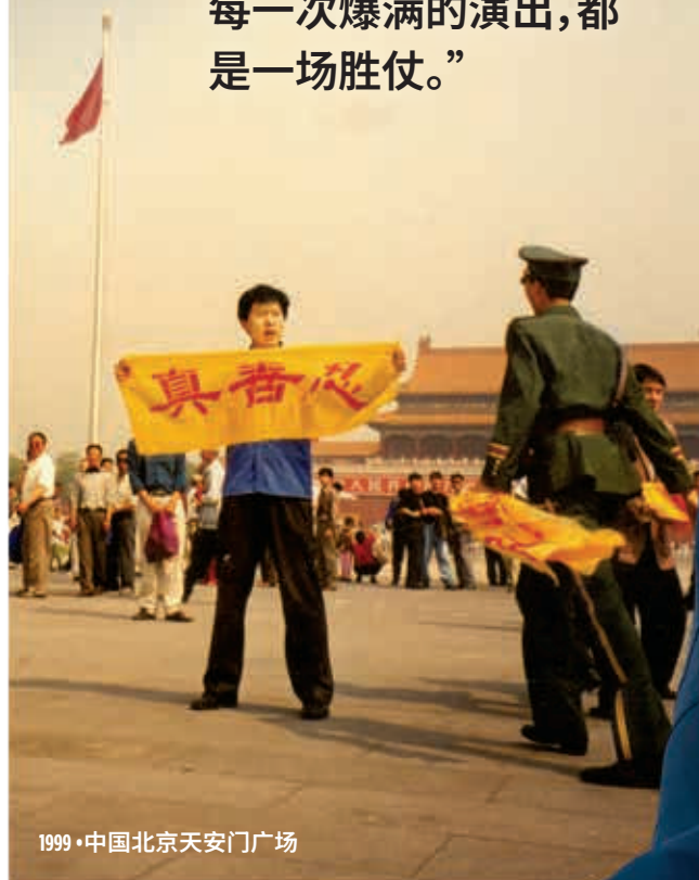
1999 • 中国北京天安门广场