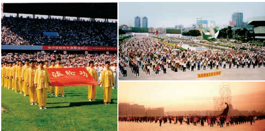
在1990年代，法轮功主要是透过口耳相传方式传播，风靡全国，吸引了数以千万计的中国人走入修炼行列。