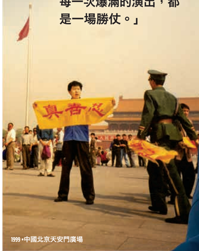
1999 • 中國北京天安門廣場