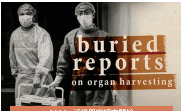
2006·活摘器官調查開始

《紐約時報》的這些報導，儘管明顯帶有選擇性與偏見，卻正好促成了這一波在美國及全球媒體中對法輪功的錯誤資訊傳播，也為法律戰提供了輿論支撐，詭異地與中共的計畫不謀而合……那麼《紐約時報》為什麼要這麼做呢？為什麼這份所謂的「權威報紙」在中共政權摧毀神韻藝術團、「在全球範圍內消滅法輪功」的全球推動下突然關注神韻？