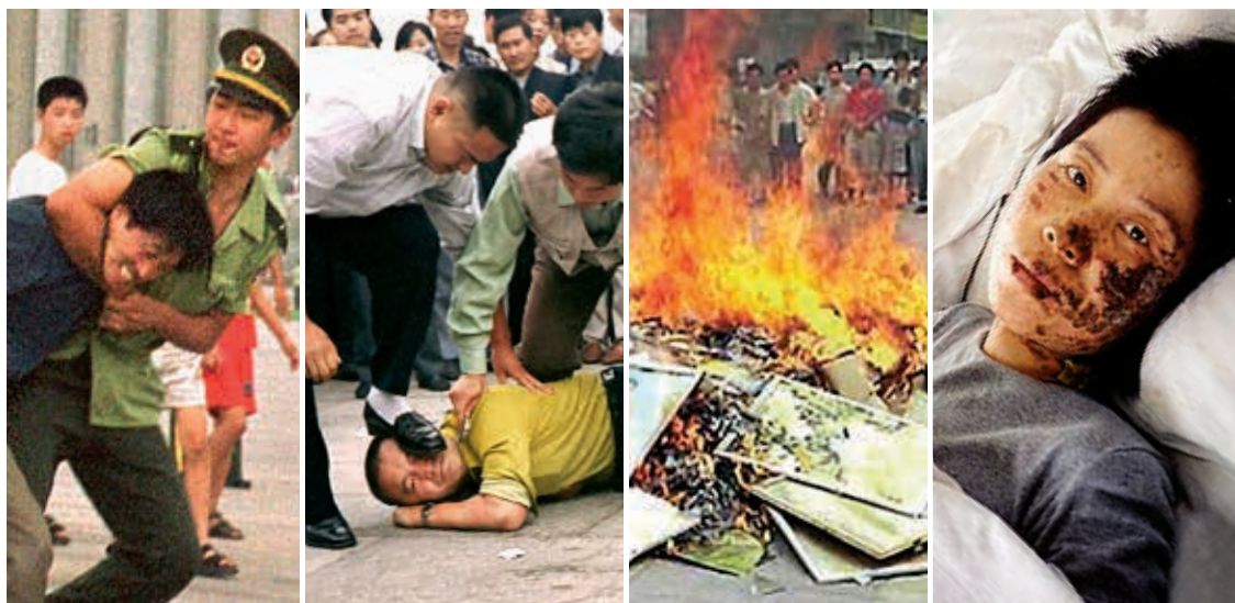
在中國，數以百萬計的人僅僅因為修煉法輪功就被開除工作、被學校勒令退學、遭到監禁、遭受酷刑，甚至被迫害致死。全國各地還曾發起焚書運動，將法輪功書籍付之一炬。

國有企業、學校和政府機構開始強制舉行「再教育」課程，試圖根除這一精神修煉，灌輸共產主義思想。官方媒體鋪天蓋地的播放抹黑宣傳，妖魔化法輪功。數以百萬計無辜的中國民眾僅僅因為修煉法輪功，就被開除工作、開除學籍、監禁、酷刑折磨，甚至被奪走生命。